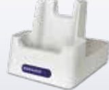
91ACC0073 Einfach- Ladestation nur zur Ladung