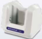
91ACC0072 Einfach- Ladestation mit Verschluss