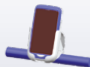
91ACC0047 Einkaufswagenhalter (60 St.)